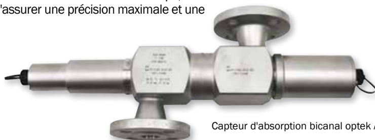
Capteur d'absorption bicanal optek AF26

Dans nos brochures TOP 5, vous trouverez toutes les informations spécifiques aux applications de votre branche industrielle.